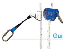
Gama urządzeń stopfor™

Urządzenia przeciwnospadkowe Tractel® są przeznaczone do pracy na wysokości gdzie istnieje możliwość upadku pionowego jak i pracy na płaszczyznach poziomych gdzie istnieje możliwość spadku z ostrej krawędzi (dachy płaskie).