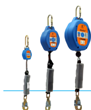
Gama urządzeń blocfor™

Tak więc nasza gama blocfor™, stopfor™ oraz linki asekuracyjne* są certyfikowane zgodnie z kartami :